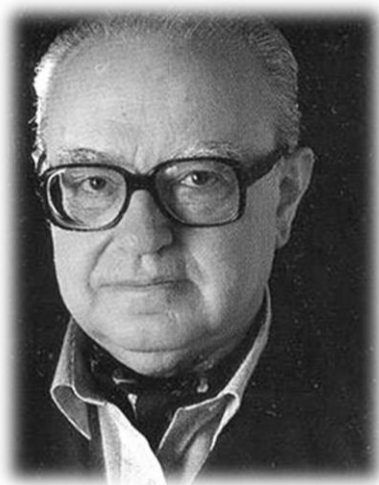
El gran compositor argentino Alberto Ginastera fue el fundador y primer director del Conservatorio Julián Aguirre.

Es una Institución musical oficial fundada por el gran compositor Alberto Ginastera en 1951, dependiente de la Dirección de Educación Artística de la Provincia de Buenos Aires.