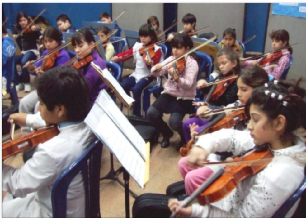
ORQUESTA INFANTIL (Proyecto de extensión del Conservatorio y la EEP.31)

ATENCIÓN: No se inscribirá a quienes no tengan TODA LA DOCUMENTACIÓN