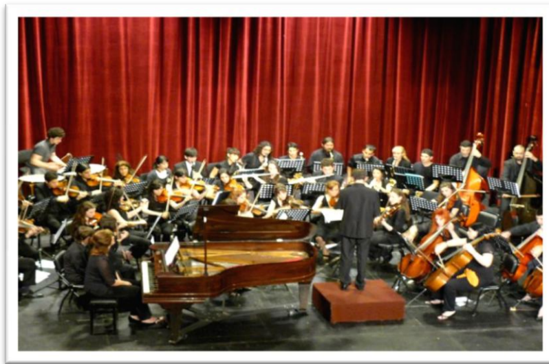
La Orquesta Sinfónica del Conservatorio Julián Aguirre en el Teatro Roma