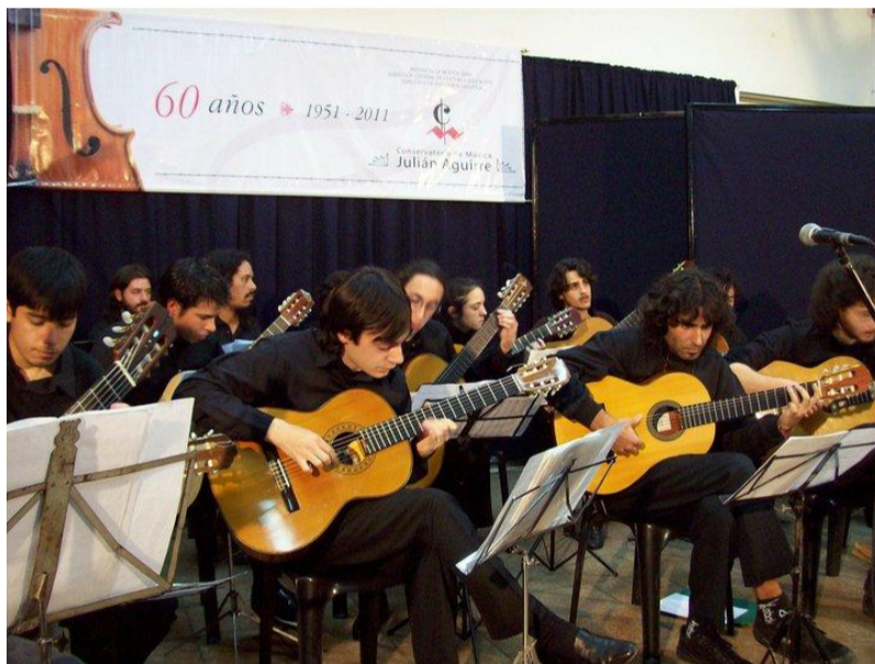
Ensamble de guitarras del Conservatorio J. Aguirre

Nota: PARA ASPIRANTES A INGRESO 2016: El Taller de Integración Musical (TIM) comenzaría en abril del 2015. La inscripción se realiza en mesa de entrada. Se recomienda cursar en los primeros meses, pues las vacantes se agotan rápidamente.