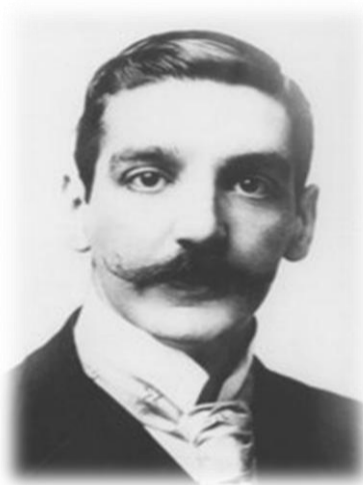
En 1957 se designa a la Institución con el nombre de otro gran compositor argentino en su memoria, Julián Aguirre .

Las autoridades e integrantes del Conservatorio Julián Aguirre son: